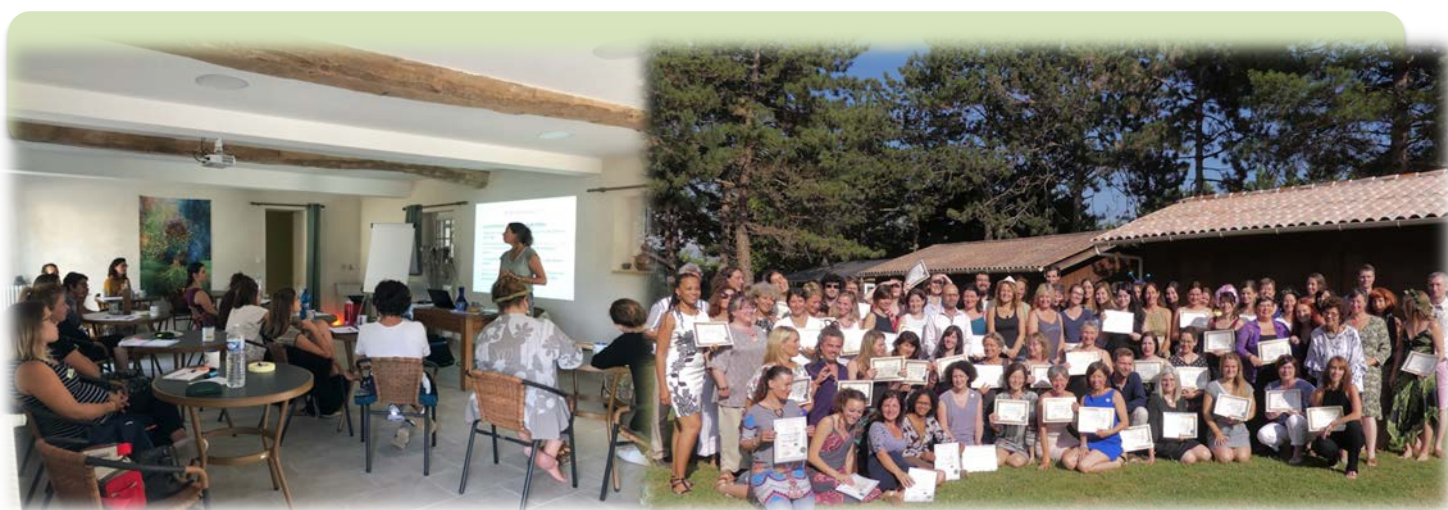
LES INTERVENANTS DU CNR 51, REIMS